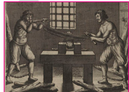
Voor straf hout raspen in het Rasp-huis (tuchthuis).

midden: Onthoofding op het Groene Zoodje, gravure uit tweede helft 17e eeuw (Atlas van Stolck)