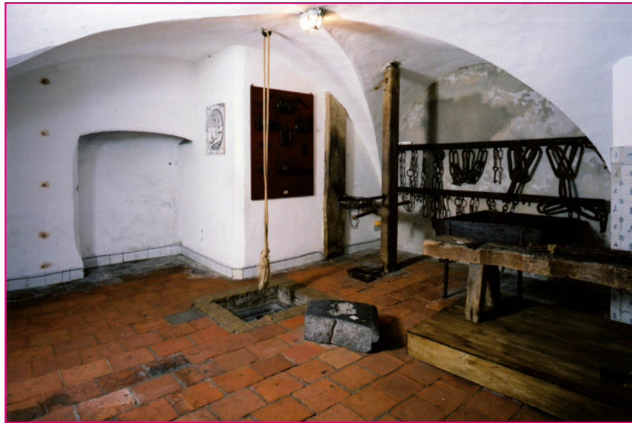
De Pijnkelder in de Gevangenpoort, waar een verdachte tijdens het verhoor werd gemarteld.