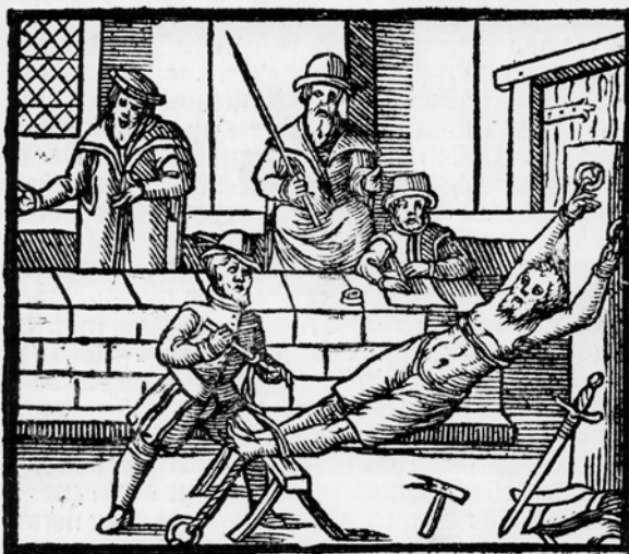
Een scherp verhoor, houtsnede uit 1555 (Koninklijke Bibliotheek)

Het Hof van Holland was de belangrijkste rechtbank van de provincie Holland en was gevestigd in Den Haag. De rechters van dit Hof verhoorden de verdachten in de Examineerkamer van de Gevangenpoort.