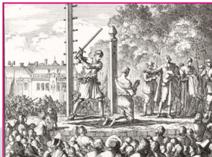
Een doodstraf op het Groene Zoodje, het schavot van Den Haag.