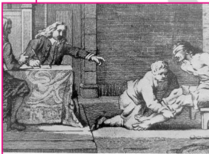
Het verhoor van Cornelis de Witt in de Gevangenpoort. De rechters (links) geven de beul de opdracht om scheenschroeven aan te brengen.