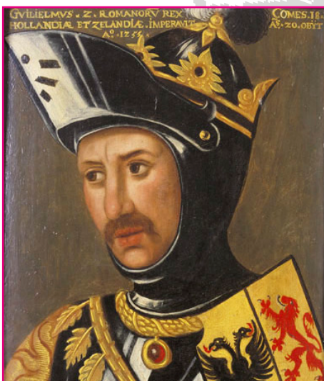
1. Graaf Willem II, schilderij uit ca. 1600

De plek waar de graven hun nieuwe huis lieten bouwen, was perfect. Er lag een groot bos in de buurt (het Haagse bos), waar veel wild was, zodat ze daar op konden jagen. De plek was ook goed te bereiken, want er liep een aantal belangrijke wegen langs. Zo konden ze snel in grote steden als Leiden of Gouda zijn.