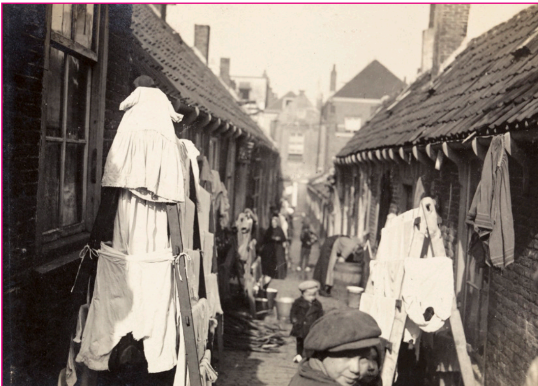
2.1. Het Kleine Kroonhofje, foto uit ca. 1915

In 1843 reed de allereerste trein station Hollands Spoor binnen. Doordat Den Haag met het spoor verbonden was, wilden veel fabrieken zich hier vestigen, in de buurt van het station. Veel arme mensen van het platteland trokken naar Den Haag om in een van de fabrieken te gaan werken. Hierdoor groeide het aantal inwoners explosief.