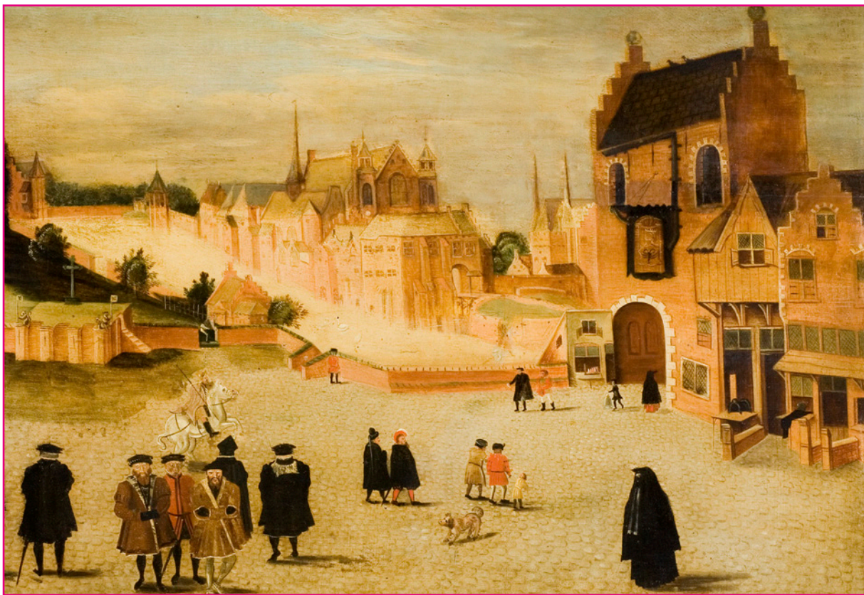
2. De Gevangenpoort, schilderij uit ca. 1550 - 1565

Het nieuwe huis werd naast een meertje gebouwd, waarin schoon water uit de duinen stroomde. Je kent het meertje vast wel, want het ligt nu midden in de binnenstad. Natuurlijk, de Hofvijver! Het huis van de graaf zou later uitgroeien tot de meest gefilmde en gefotografeerde plek van Nederland, het Binnenhof. De zoon van graaf Willem II, Floris V liet het bekendste gebouw van het Binnenhof bouwen, de Ridderzaal. Hij liet ook het duinmeertje uitgraven. De berg zand die daar uit kwam heet nu nog steeds Vijverberg.