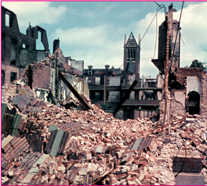
23. Bombardement op het Bezuidenhout, foto in 1945 gemaakt door Wim Berssenbrugge

Op 3 maart 1945 bombardeerden Engelse vliegtuigen de woonwijk Bezuidenhout. Het doel was eigenlijk de Duitse raketinstallatie in het Haagse bos, maar een communicatiestoring zorgde ervoor dat de woonwijk werd getroffen. Er vielen tientallen slachtoffers en honderden mensen raakten dakloos.