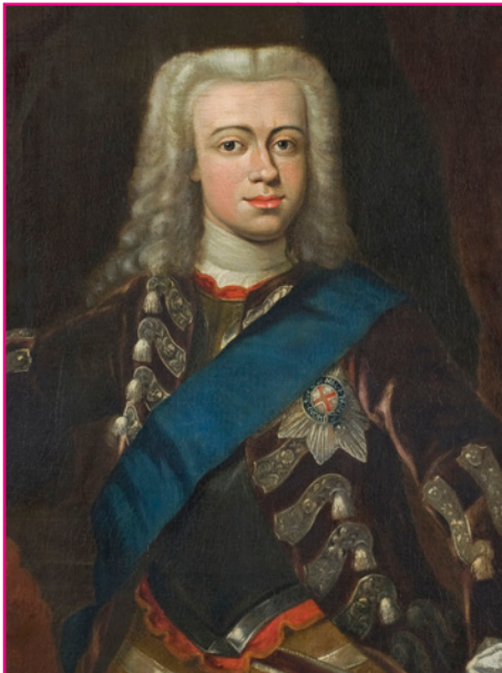
14. Prins Willem IV, schilderij uit ca. 1750 15. Mozart in Den Haag

Toen Willem III in 1702 stierf, had hij geen kinderen, dus ook niemand, die hem als stadhouder kon opvolgen. Na 45 jaar geruzie om de opvolging werd uiteindelijk in 1747 de Friese neef van Willem III benoemd tot stadhouder Willem IV. Lang kon hij niet van zijn nieuwe baan genieten, want in 1751 stierf hij.