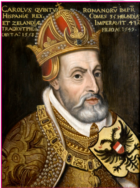
3. Karel V, schilderij uit ca. 1600

Karel V was de machtigste man van zijn tijd. De titel graaf van Holland was via erfenissen en huwelijken in zijn bezit gekomen. Maar hij was ook nog koning van Spanje en keizer van het Duitse rijk. De mensen zeiden ook wel dat Karel een rijk had, waar de zon nooit onder ging. Als graaf van Holland woonde hij niet op het Binnenhof, want dat was te klein en te bescheiden voor keizer Karel. Hij had een enorm paleis in Brussel, waar hij meestal verbleef.