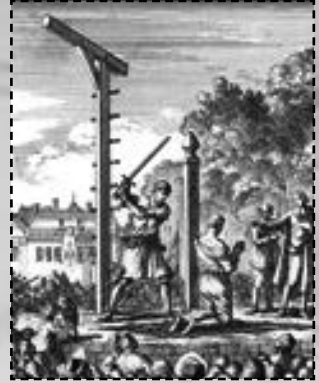
Ritmeester Buat, veroordeeld voor landverraad, wordt op 11 oktober 1666 op het Groene Zoodje onthoofd.

Op het Groene Zoodje werden verschillende doodstraffen uitgevoerd. Zo kon je worden opgehangen, verbrand, of onthoofd. Onthoofding werd gezien als de meest pijnloze