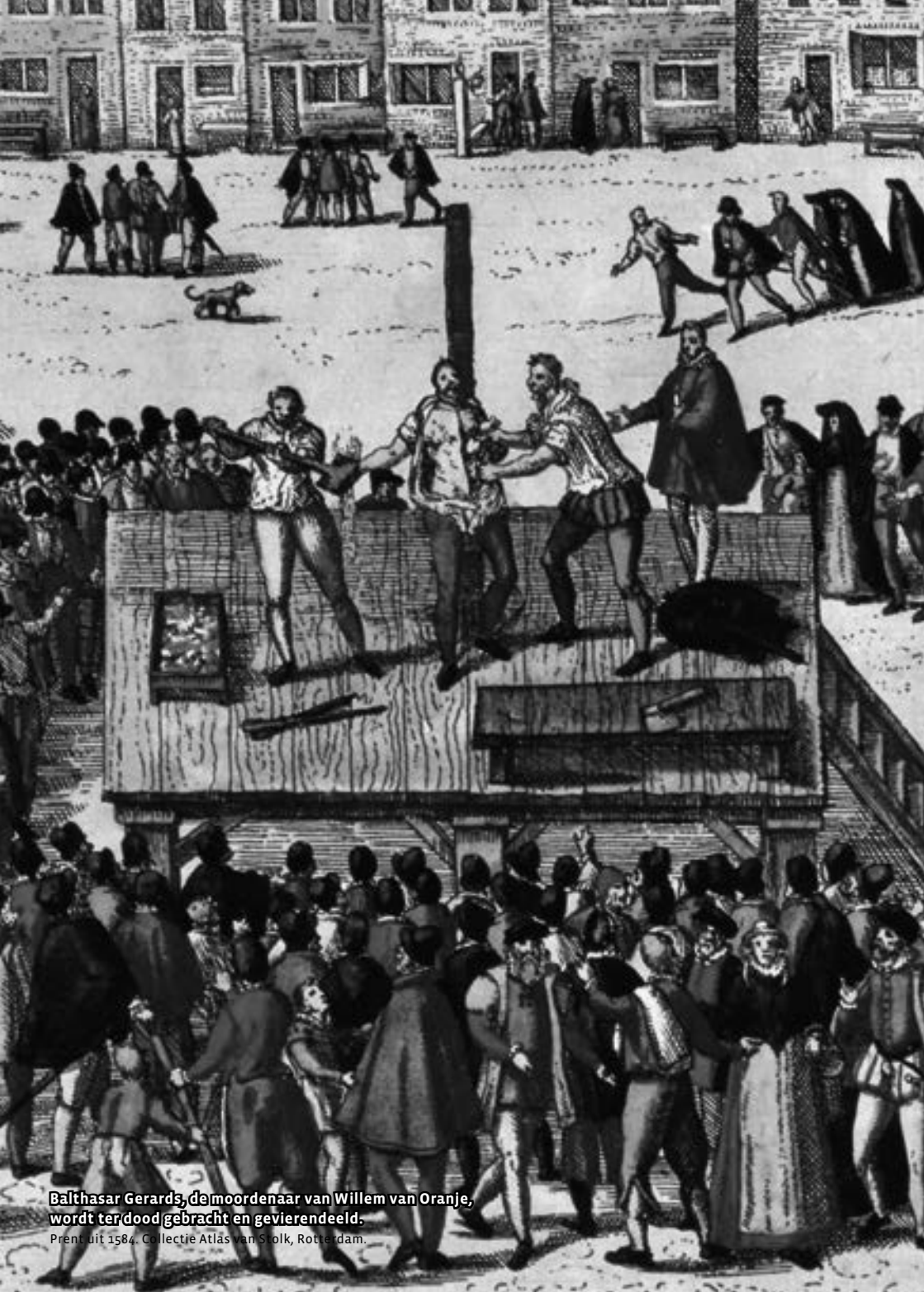
Balthasar Gerards, de moordenaar van Willem van Oranje, wordt ter dood gebracht en gevierendeeld.

Prent uit 1584.