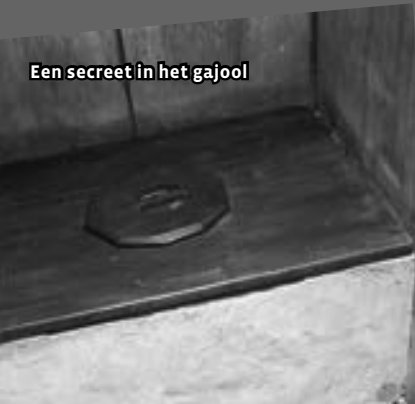
Een secreet in het gajool

Tegenwoordig moeten wanbetalers soms ook naar de gevangenis, bijvoorbeeld als ze heel veel boetes van de politie niet hebben betaald. Een wanbetaler kan dan kiezen: of meteen alles betalen, of naar de gevangenis. De wanbetaler mag maximaal 7 dagen worden vastgezet in het huis van bewaring . Als de wanbetaler weer vrijgelaten wordt, moet hij natuurlijk nog wel de boete betalen. Ook kan een wanbetaler een strafblad krijgen. Hierover lees je later meer.