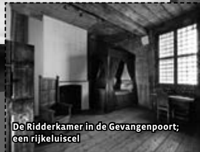
De Ridderkamer in de Gevangendoor; een rijkeluiscel

Als je rijk was, kon je een grotere cel voor jou alleen krijgen. Je moest daar natuurlijk wel voor betalen. Maar je had dan wel een vuurtje in je cel om je handen te warmen, een eigen bed, en je mocht zelf kiezen wat je wilde eten. Een voorbeeld van zo'n cel voor de rijken is de Ridderkamer in de Gevangendoor.